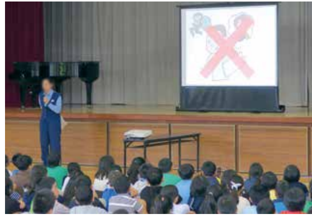
▲防犯教室（笹目小学校）

議員 通学路の「こども110番の家」の確認と家主との交流を行うてはどうか。 議員 通学路は随時的に「こども110番の家」の導入の考えは。 市民生活部長 ①自治基本条例制定に向けた「市民協働ワーキング」と、公共施設に関する意見交換会「まちのデザイン会」において実施②自治基本条例では、参加・参画の原則を掲げており、市民参加は重要不可欠。無作為抽出による会議は、その