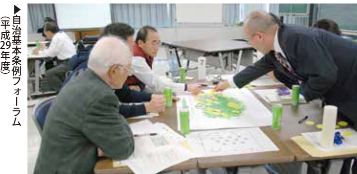
▶自治基本条例フォーラム (平成29年度)